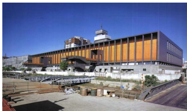
图8 宁波美术馆外观