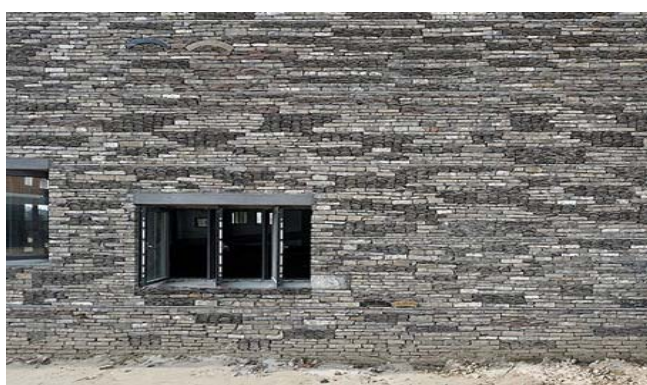
图9 中国美院象山校区某建筑外墙面

“瓦片墙”是王澍建筑作品中常用到的一种民间营造技术，这种技术来自于明清时期的浙东，当时由于建筑材料匮乏，普通工匠就采用大户人家弃用的残砖碎瓦砌墙，由此形成了“瓦片墙”这一民间传统工艺。王澍设计的中国美院象山校区、宁波博物馆和上海世博会宁波滕头馆都在外立面上用到了“瓦片墙”，这种用回收砖瓦砌筑的外墙面，色彩变化细腻而丰富，建筑在建成之时就已经携带了丰富的历史信息(图9, 10)，这种“喻新于旧”的作法使人们在辨别建筑的新旧之时萌发对历史与传统的思考。