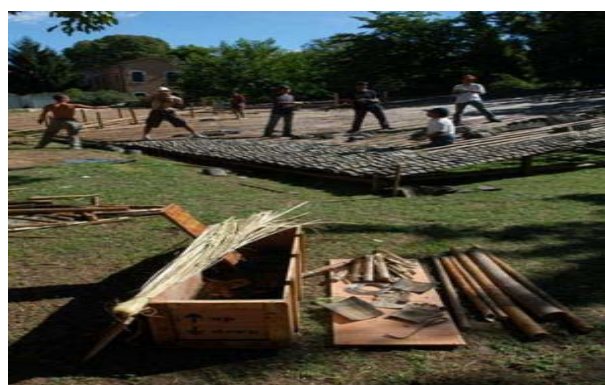
图13, 图14 瓦园及其建造过程

在这个经济利益主导的时代, 社会的各个领域几乎都充斥着求新求快的思想, 建筑行业正是这种现象的典型, 大拆大建的现象几乎无处不在。在这种状态下, 一些乡土的建筑方式虽具备成本低能耗小等优点, 但却一般会被认为没有效率也没有新意而得不到运用。