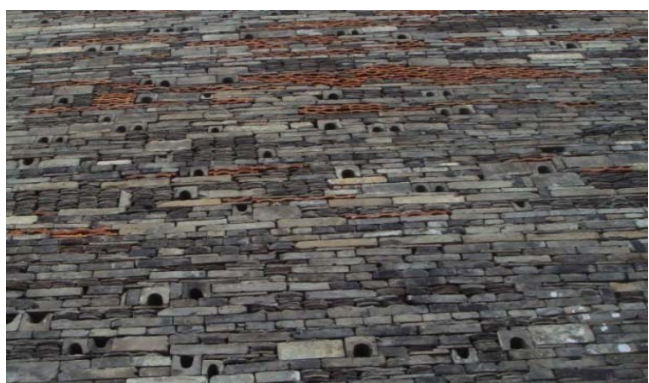
图5 宁波滕头馆外墙面

从传统建筑老房子中回收的砖瓦也是王澍经常用到的材料。上海世博会宁波滕头馆的建造中就用到了这种砖瓦共计50多万块(图5)。这些旧砖瓦都是从宁波的象山、鄞州、奉化等地的大小村落收集而来,有元宝砖、龙骨砖、屋脊砖等。由这些超过100年历史的砖瓦砌筑而成的墙面,向往来的人们诉说着百年的故事。而早在中国美院象山校区一期二期工程实践中,王澍就已经尝试了将回收砖瓦作为建筑立面材料,种类不一历时不同