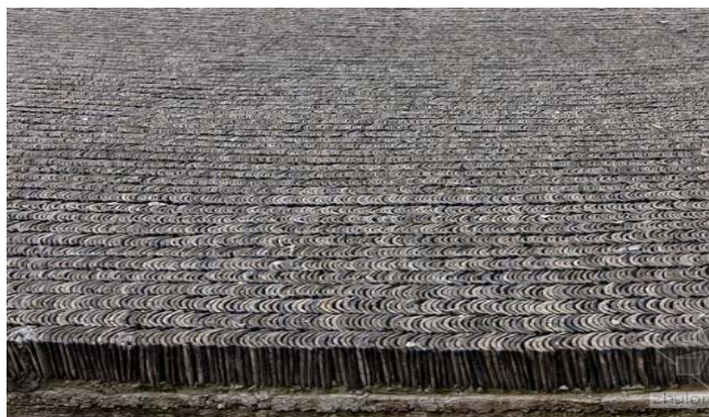
图4 中国美院象山校区某建筑屋顶