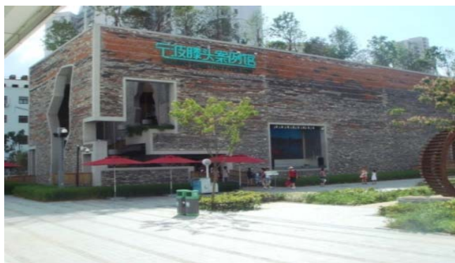
图1 宁波滕头馆外观

在上海世博会中,王澍设计了其中唯一的乡村案例馆——城市最佳实践区中的宁波滕头馆。这栋建筑从外观上看,是一个表面开了很多规则和不规则洞口的尺度巨大的简洁长方体(图1),似乎看不出与乡村生活的关联,只有外墙面上红灰相间的回收砖瓦传达出些许的乡土气息。然而,进入展馆的内部,乡间小路、树林、稻田、荷塘、爬藤、水气、鱼池这些景象立刻将参观者带回了自然亲切的乡村生活(图2),王澍也因此而被媒体授予了世博会“乡村建筑师”的称号。虽然这一称号并不能说明王澍建筑思想的全部,但却很好反映了他在建筑设计中延续传统、延续自然的人文关怀。可以说,王澍是一位根植传统的现代设计师,不仅赞誉乡土建筑的自发性和朴素性,而且自觉地使用乡土营造的理念和技术,建筑作品中也流淌着朴实自然的气息。