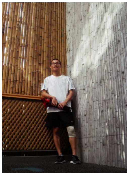
图11 宁波滕头馆室内

“竹模板现浇”做法源于一般的混凝土现浇做法，在乡村农宅的建造中，由于现浇技术比较粗糙，拆模后不太平整的模板总会在混凝土表面留下粗糙的痕迹。王澍巧妙地利用竹篾织模，待混凝土成型后，竹篾可留在其表面作为贴面，也可将竹篾拆除而在混凝土表面留下竹材的纹理，这一做法极为巧妙地使乡土施工的缺陷转变为效果独特的工艺。在世博会宁波滕头馆中，这种“竹模板现浇”的做法为建筑创造了一种独特的室内效果，保留竹模的竹贴面覆盖在混凝土上，传达着自然朴实的乡土气息，而拆除竹模的混凝土由于带有细腻的竹纹而不再冰冷(图11)。