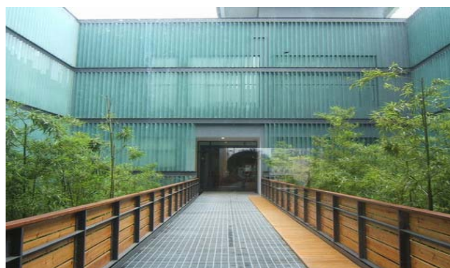
图7 宁波美术馆内部栏杆