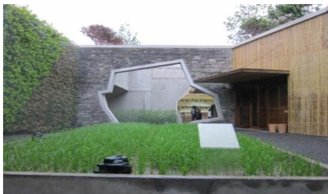
图2 宁波滕头馆内部