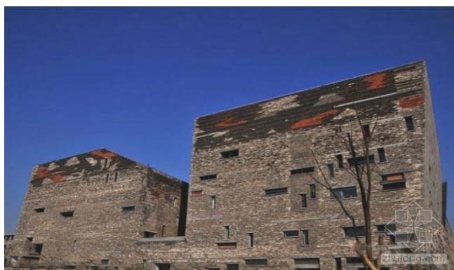
图10 宁波博物馆外墙面

“竹模板现浇”做法源于一般的混凝土现浇做法，在乡村农宅的建造中，由于现浇技术比较粗糙，拆模后不太平整的模板总会在混凝土表面留下粗糙的痕迹。王澍巧妙地利用竹篾织模，待混凝土成型后，竹篾可留在其表面作为贴面，也可将竹篾拆除而在混凝土表面留下竹材的纹理，这一做法极为巧妙地使乡土施工的缺陷转变为效果独特的工艺。在世博会宁波滕头馆中，这种“竹模板现浇”的做法为建筑创造了一种独特的室内效果，保留竹模的竹贴面覆盖在混凝土上，传达着自然朴实的乡土气息，而拆除竹模的混凝土由于带有细腻的竹纹而不再冰冷(图11)。