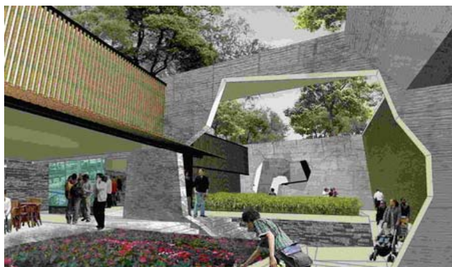
图25 宁波滕头馆内部乡土景观