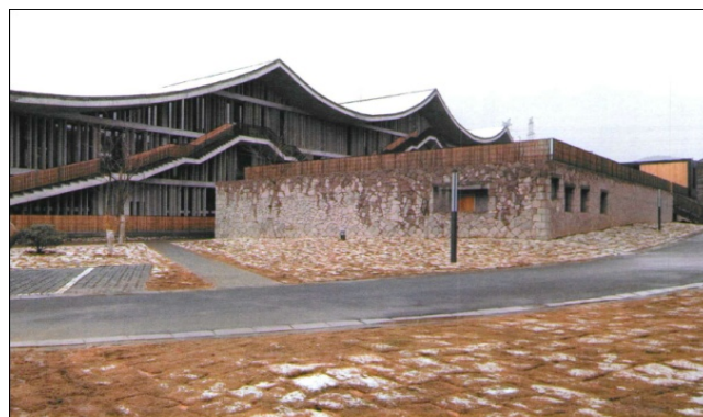
图12 碎石砌筑建筑外立面

碎石砌筑也是民间常用的建造方式，这种建造方式常被农民用来建造房屋的基础和挡土墙，王澍的建筑中也会用到这种建筑方式。在他设计的中国美院象山校区二期工程的一栋建筑中，碎石砌筑被用在建筑的外立面上，整个建筑表现出一种生长于大地的亲切感(图12)，王澍的创意使石块从作为基础等被忽视的角色变为建筑表现的主体。