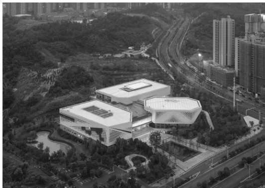
图 2: 浅色调设计 (浏阳三馆项目)

独特的文化氛围。例如在浏阳三馆项目中，由于该地区属于夏热冬冷区域，气候冬季寒冷，夏季炎热，建筑外墙则常采用浅色调的墙体材料，以给人一种清爽宜人的感觉。同时配合着独特的造型，以富有韵律的三角形开窗为表皮装饰，配合着液晶灯的变化，动态模拟出烟花绽放的效果体现主城市的特色，设计效果如下：