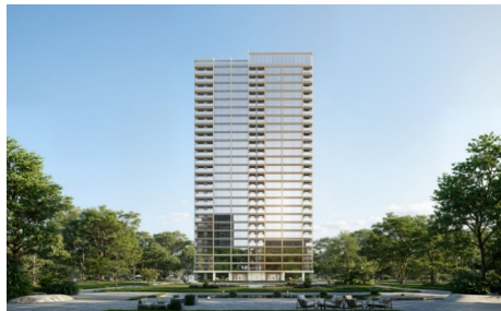
图4 高层住宅立面图

依托高品质外立面不计容的政策激励，选用阳极氧化铝板、天然石材、金属型材等耐久高端的建材，兼顾立面质感与长期使用寿命，同时精细化打磨门窗比例、檐口造型、转角收口等细部节点，杜绝粗制滥造。同步做好屋顶第五立面设计，规范设备遮蔽、优化绿化衔接，做到立面美观、材质精良、细节考究，既符合政策风貌管控要求，又彰显海派建筑精致考究的独特格调。