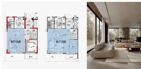
图5 室内使用的可变性

打造 LDK 一体化客餐厨空间，打通客厅、餐厅、厨房公共活动区域，拓宽家庭互动社交空间；预留多功能弹性房间，可灵活适配书房、儿童房、储物间、健身房等多种用途，满足家庭全生命周期的居住需求。同步优化入户玄关、厨卫空间尺度，全方位满足政策对居住功能完善的要求。