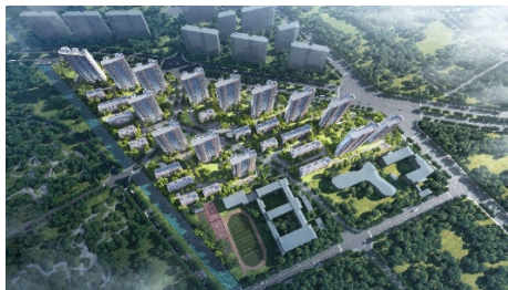
图1 招商臻境鸟瞰图

三林招商臻境位于上海三林板块，是贴合“好房子”政策打造的高端改善型住宅，也是浦东三林新政策落地后的品质标杆项目。项目定位改善居住社区，主打大尺度舒适户型，依托政策激励红利，严格对标高品质住宅标准，兼顾公共空间营造、海派风貌传承、户型宜居优化、绿色健康赋能，打造兼具现代精工质感与海派人文底蕴的宜居范本，实现居住品质、城市风貌与市场价值协同提升。